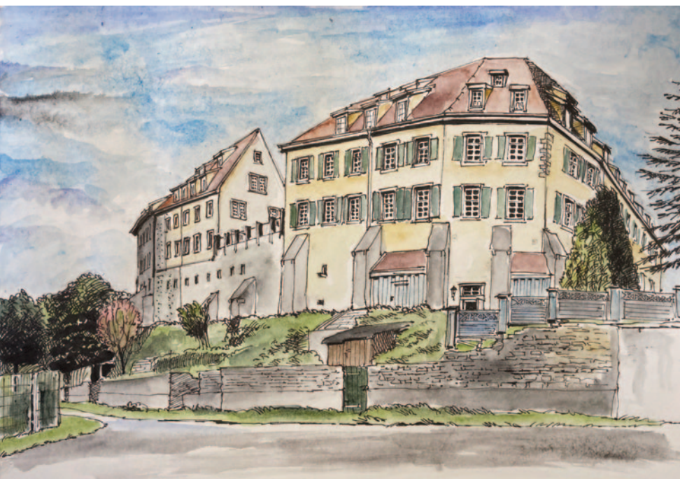
Illustrationen: Benjamin Fischer

CVJM-Lebenshaus „Schloss Unteröwisheim“ Mühlweg 10 76703 Kraichtal-Unteröwisheim 07251-98246-20 lebenshaus@cvjmbaden.de